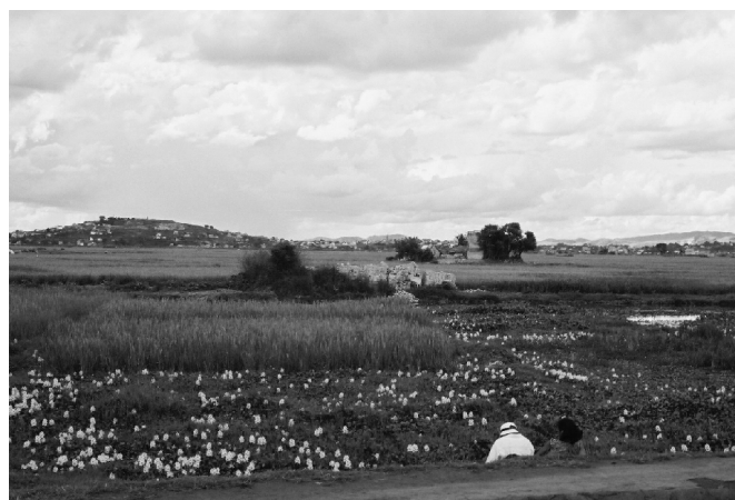
Photo 2. Plaine rizicole d'Antananarivo le long de la route-digue (centre-ville à 3 km).

l'objet d'aucun encadrement technique. Or, l'urbanisation et l'industrialisation rapides de la capitale malgache la concurrencent directement (remblais sur les terres agricoles, habitat formel et informel, rejets polluants dans l'eau à usage agricole) et la rénovation en cours des plans d'urbanisme interroge directement le devenir des espaces agricoles (Cities Alliance, 2004).