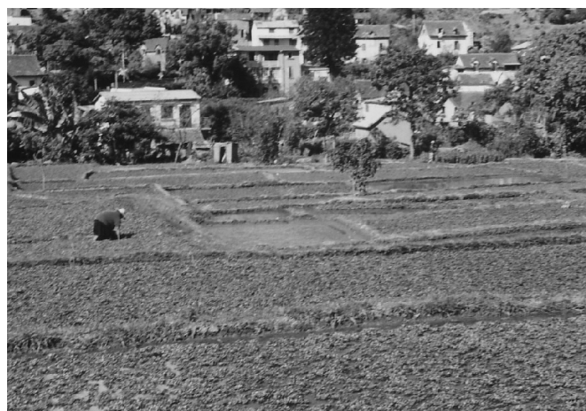
Photo 1. Cressonnières dans le vallon d'Ambanidia, à Antananarivo-ville (centre-ville à 1,5 km).

À Antananarivo, capitale de Madagascar, ville tropicale de montagne, l'habitat s'est traditionnellement concentré sur les collines et les sommets, en laissant les vallons et les zones de plaine à l'agriculture. Aujourd'hui, celle-ci est présente jusqu'au centre-ville (Photos 1 et 2), où elle continue d'occuper les bas-fonds les plus inondables, la plaine environnante, récemment réaménagée hydrauliquement, et les collines périurbaines : elle représente 43 % des quelque 425 km 2 de l'agglomération (Rahamefy et al. , 2005). Cependant, elle reste très méconnue et n'est