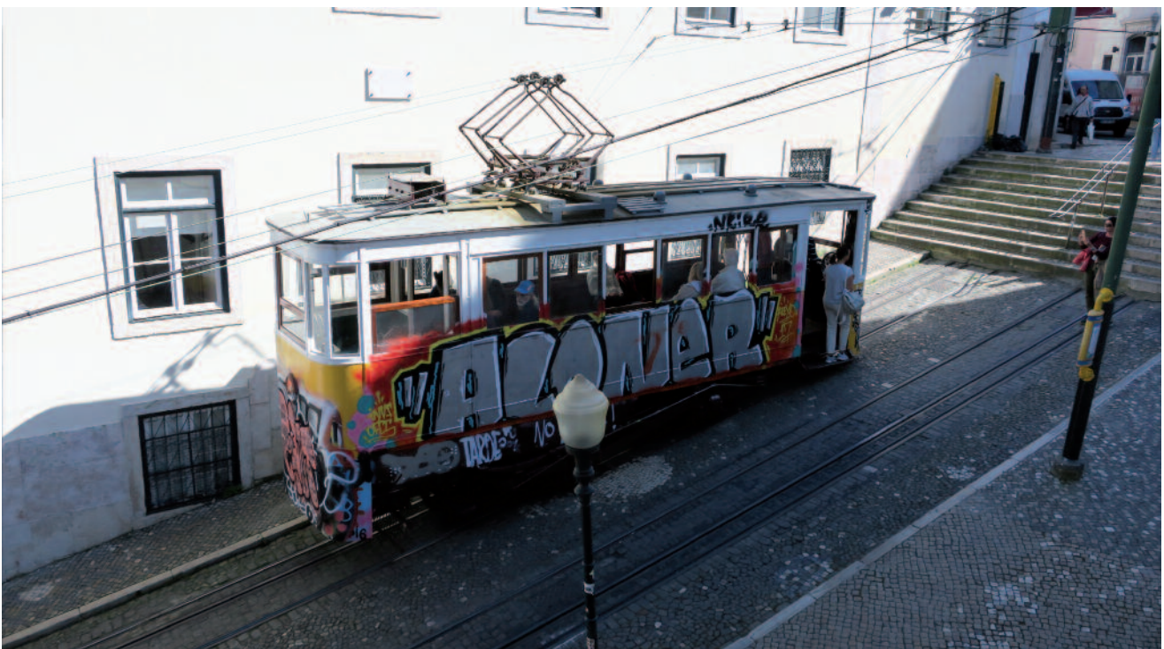
■ Figure 7 : un des véhicules de l'Elevador da Glória.

De plus, plusieurs ascenseurs publics ont été construits à la même époque, dont le célèbre Elevador de Santa Justa.