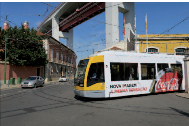
■ Figure 4 : une rame Siemens à plancher bas sortant du dépôt de Santo Amaro, et partant en direction de Belém. Le dépôt est branché sur les voies empruntées par la ligne 15E, qui empruntent l'ancienne route royale allant de Lisbonne à Belém. Le site est dominé par le pont du 25 avril, dont le tablier inférieur porte la voie de chemin de fer franchissant le Tage, et le tablier supérieur; l'autoroute (photo : Luc Charansonney).

Le réseau de tramway est exploité par Carris.