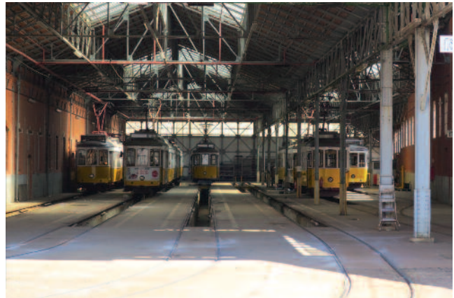
■ Figure 5 : vue d'une des halles du dépôt de Santo Amaro

Début 2017, les travaux de remise en service de la ligne 24E, une des dernières victimes des vagues de démantèlement des années 1990, ont débuté, avec notamment le